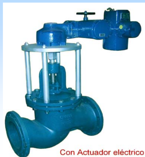
Con Actuador eléctrico